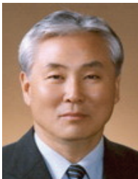
이명철 서울대 의대 명예교수/ 前)과학기술한림원장

펜실베니아대학교대학원 석사 서울상공회의소 제20대 대의원선출 경북고등학교 총동창회장 前)대선제분 대표이사 회장 前)(사)한국쌀가공식품협회 회장