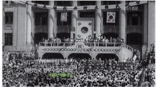
그림 1. 대한민국 건국수립 선포식, 1948년 8월 15일

여하였지만 김구 등의 한독당은 반대하여 남북협상을 추진하게 된다. 김구·김규식 등은 '남북대표자 연석회의' 개최를 제의하여 북한에까지 다녀왔으나 아무런 성과를 거두지 못하였다. 남한만의 총선을 반대한 남로당은 1948년 2월 7일 전국적인 총파업을 전개, 4월 3일에는 제주도에서